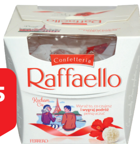
RAFFAELLO, 150 g cena za kg – od 59,67 do 59,78 zł w sprzedaży dostępne również 230 g 13,75 16,85 zł cena za 1 ka 59,78 zł