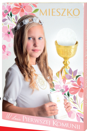
CZEKOLADKI MIESZKO TWÓJ SEKRET, 162 g cena za kg – 55,25 zł